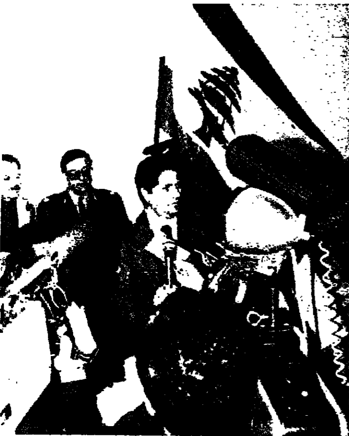
رئيس الجمهورية يلقى كلمته